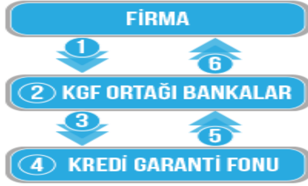
Şekil 4 PLS Başvuru Süreci