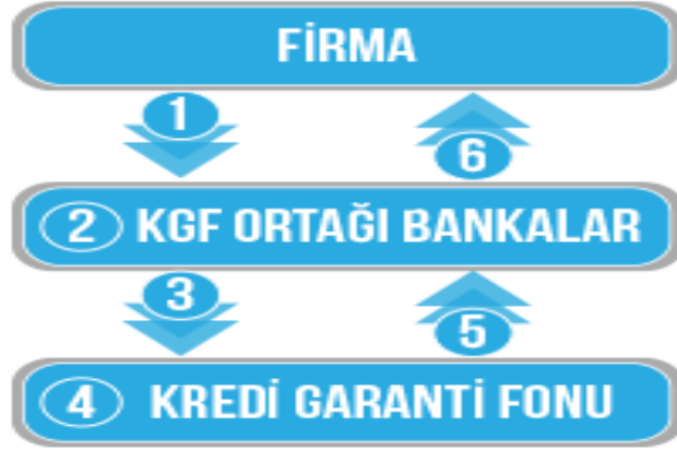
Şekil 3 PGS Başvuru Süreci

derecelendirme notları esas alınarak değerlendirildiği ve portföye sağlanan kefalet tutarı üzerinden belli bir tazmin üst limiti içinde kalmak koşuluyla kefalet sağlanan sistemdir. Kredi verilmesi uygun bulunan işletmeler için bankalarca KGF'ye kefalet başvurusu yapılmaktadır.